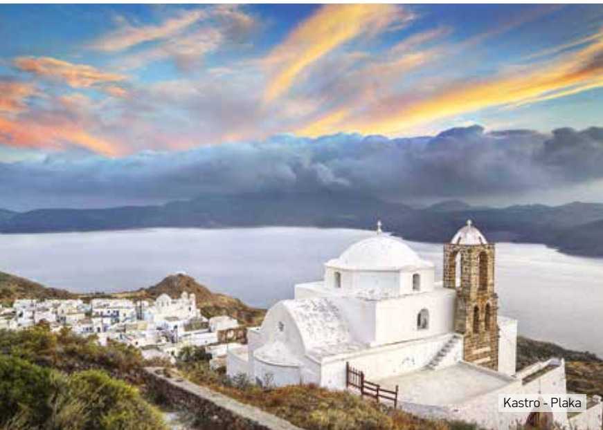
Kastro - Plaka