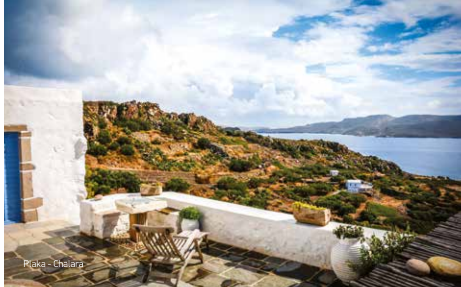
Plaka - Chalara