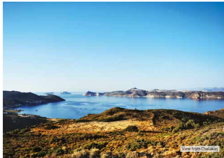
View from Chalakas